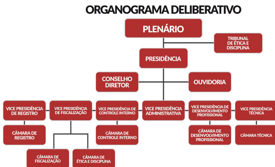
Figura 1 – Organograma Deliberativo do CRCPB.

A estrutura vigente de CRCPB apresenta o seguinte organograma deliberativo: